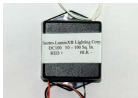
Arriba: DC-100P, Abajo: DC-100

Light Tape® puede operarse con baterías estándar. Con tan bajo consumo de corriente, es posible conseguir horas si no días de iluminación con una carga. Nuestros inversores DC pueden aceptar una variedad de voltajes de entrada. Sin embargo nuestra entrada standard es 12 voltios a menos que se especifique otra. Otros voltajes alternos disponibles como (3vdc, 6vdc, 9vdc y 24vdc) están disponibles bajo pedido especial de 250 unidades o mas.